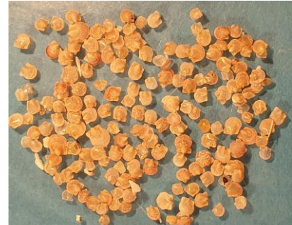
Wijde mantel, juveniel

Na de korte storm haverwege februari zijn een flink aantal leden van de strandwerkgroep vol verwachting naar het strand gegaan. Er was gehoopt op eikapsels, wat nogal tegenviel, inktvis schilden, ook niet zoveel, visjes, krabben en schelpen. In de categorie visjes werden er plots een hele serie zeepaardjes gevonden waarover later meer. Bij de krabben waren er ook leuke aanspoelsels. Wat schelpen betreft leek het strand tamelijk schoon en leeg. Maar uit het gruis dat bij laag water vrij kwam werden heel veel kleine verrassingen gehaald. Ria Walvis ging een aantal keer verzamelen en heeft na vele uren pluizen de in de tabel genoemde soorten en aantallen gevonden. Dat er in een keer gruis verzamelen 1650 juveniele wijde mantels mee naar huis komen was voor alle werkgroepleden een nieuwe ervaring. Ook heb ik zelf een begin gemaakt met het opbouwen van een verzameling van horentjes kleiner dan een halve centimeter. De bescheiden resultaten daarvan staan in de rechter kolommen en hebben gezorgd voor veel avonden microscopisch plezier en wat begeleidende foto's.