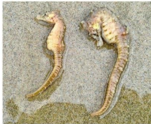
De levende kortsnuitzeepaardjes lagen in het natte zand.

Nederland vooral bij Zeeland, daar groeien veel wieren en planten in het water. Ze hebben maar één rugvinnetje en kunnen zich aan de wieren vasthouden met hun staart. Zo jagen ze op garnaaletjes en zijn ze gelijk goed verstopt voor vijanden. Hier voor de kust ligt een zandbodem, ze hebben nergens houvast.” Het kan ook zijn dat de zeepaard-