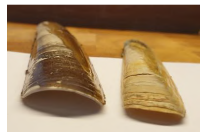
Groot tafelmesheft links Klein tafelmesheft rechts