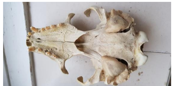
Schedel Gewone zeehond

Twee dagen later vonden Lucette en Luc Knijnsberg op de Hors op Texel een kortsnuitzeepaardje! Verder verzamelden ze daar 47 eikapsels van stekelrog, 1 golfrog, 13 gevlekte rog, 50 paarse zeepokken, 2 gedoornde zeekatschilden en 2 bonte mantels.