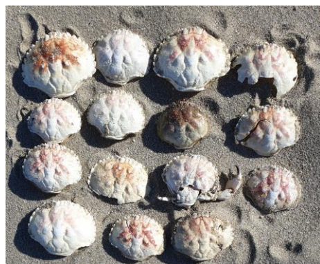
Rugschilden Ovaalronde krab