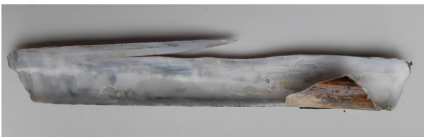
Groot tafelmesheft Petten

Bij Petten raapte Linda Haulo op 6 januari een verse klep van een groot tafelmesheft (20 cm) met nog een deel van de andere klep eraan. Na deze melding ontstond nog enige twijfel over de determinatie. Jonge groot tafelmesheften beginnen natuurlijk ook met een kleine schelp, verschillen tussen de mantellijn en de vorm van de buitenkant kunnen dan lastig te beoordelen zijn. Welke verschillen zijn er dan met het klein tafelmesheft? De vorm van de schelpopening aan de achterzijde van de schelp lijkt daarvoor een goed te beoordelen kenmerk. Het groot tafelmesheft heeft een gelijkmatig gebogen schelpopening en die van het klein tafelmesheft is duidelijk vlakker. Zie de foto en let ook op de vorm van de schaduw op het vel papier.