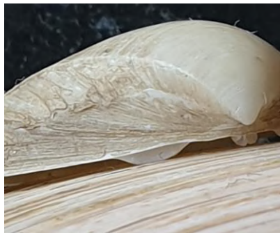
Amerikaanse strandschelp bij Den Oever en Oosterland

De harde wind begin dit jaar dreef Luc en Lucette op 17 januari richting Den Helder in hun jacht naar aanspoelsels. Met succes, want ze verzamelden op de dijk bij Huisduinen 442 eikapsels van stekelrog, 5 keer golfrog en 10 van gevlekte rog. Ook raapten ze nog 93 eikapsels van de hondshaai op waarbij er eentje een schilferige dekschelp meevoerde.