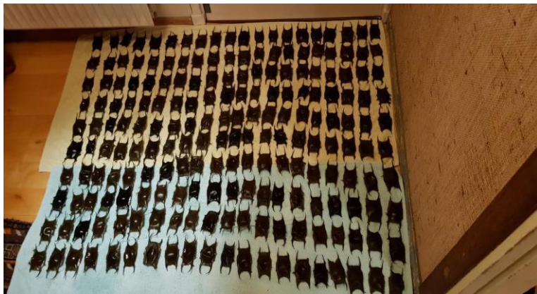
Eikapsels bij Huisduinen

De harde wind begin dit jaar dreef Luc en Lucette op 17 januari richting Den Helder in hun jacht naar aanspoelsels. Met succes, want ze verzamelden op de dijk bij Huisduinen 442 eikapsels van stekelrog, 5 keer golfrog en 10 van gevlekte rog. Ook raapten ze nog 93 eikapsels van de hondshaai op waarbij er eentje een schilferige dekschelp meevoerde.