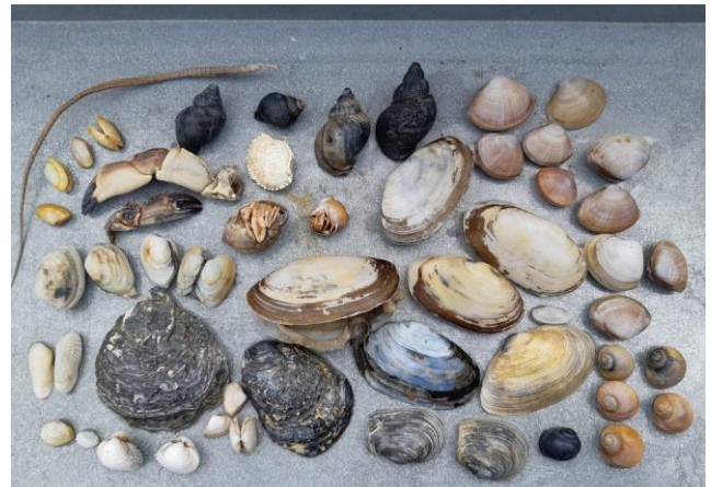
Veel doubletten bij Wijk aan Zee