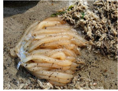
Eieren gewone pijlinktvis

20 Juni verzamelde Wilbert gruis bij Hargen aan Zee. Naast de al bekende soorten als gekielde cirkelslak, oubliehoren en stomp traliehorentje vond ik deze keer ook een kleine plaatschelp en twee doubletjes van de kleine astarte.