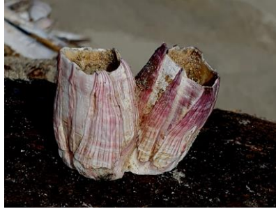
Grote roze zeepok