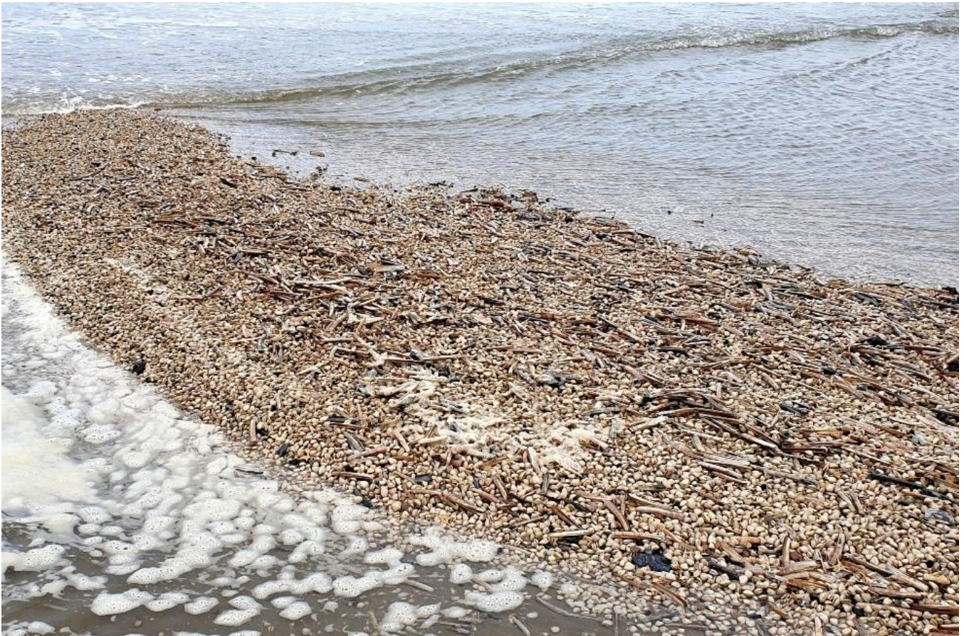
Een rif van levende Halfgeknotte strandschelpen bij Wijk aan Zee

Op 22 april meldde Boet van Heugten een spoelhoren en een gewone trapgevel van het strand bij Bergen.