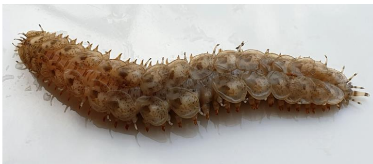
Zeerups spec. Wellicht Harmothoe impar