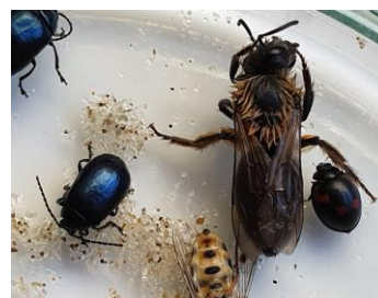
Rosse metselbij, Terrasjeskommazweefvlieg, Bladhaantjes Viervlek lieveheersbeestje