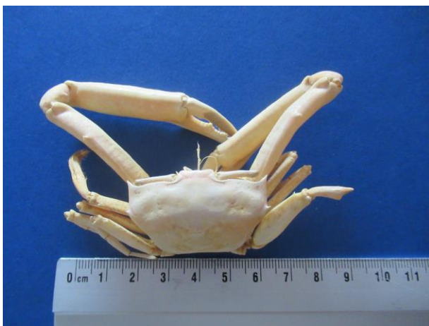
Hoekige krab van Pieter Kruse

Ook Pieter Kruse deed melding van ovaalronde krabben tussen Zandvoort en Katwijk. Nog veel mooier was zijn vondst van twee hoekige krabben in het aanspoelsel op het strand.