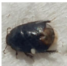
Kleine borstelige graafwants