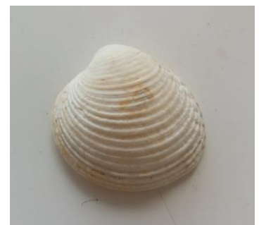
Wrattige venusschelp IJmuiden

Bij Bergen aan Zee vond Lucette op 8 mei een dodemansduim. Het betreft hier niet een restant van een ongelukkige visser, maar zacht koraal dat in de Noordzee voorkomt. In Zeeland komt het in de Oosterschelde levend voor, maar het is zeker geen alledaags aanspoelsel op de stranden van Noord-Holland.