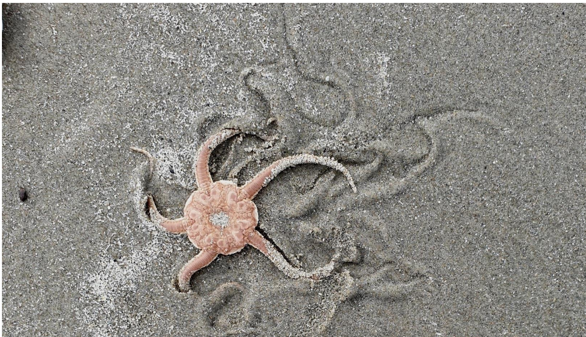
Dansende Gewone slangster bij Wijk aan Zee