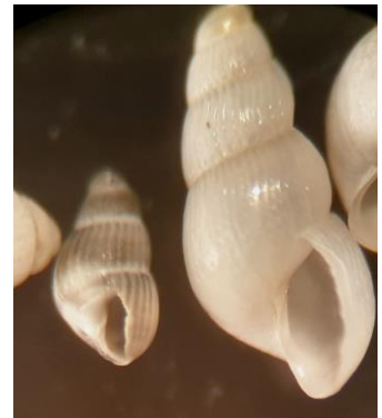
Klein en Stomp traliehorentje