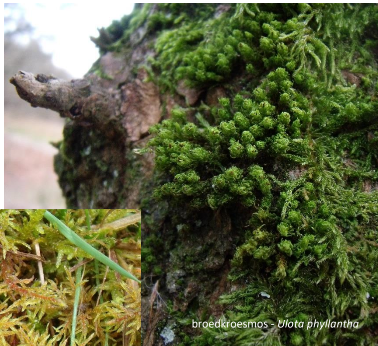
broedkroesmos - Ulota phyllantha