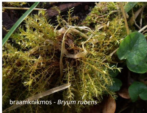
braamknikmos - Bryum rubens