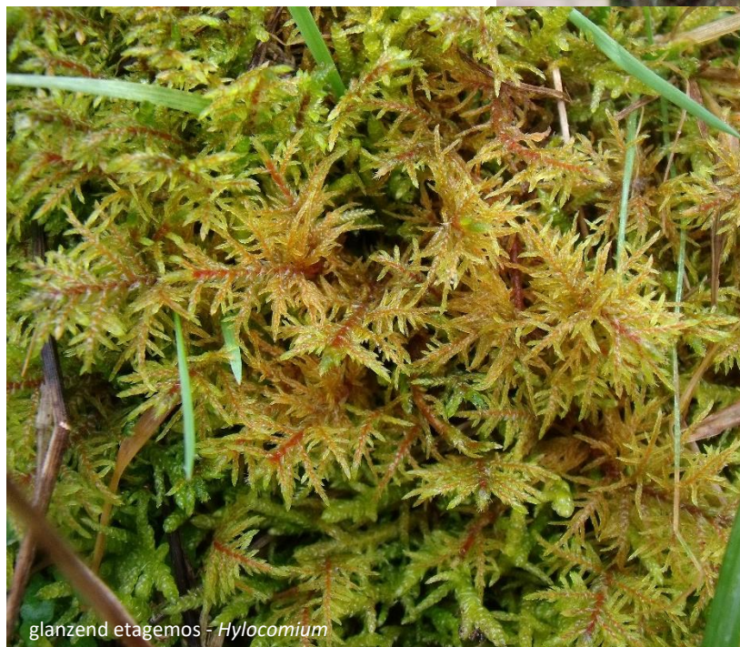
glanzend etagemos - Hylocomium