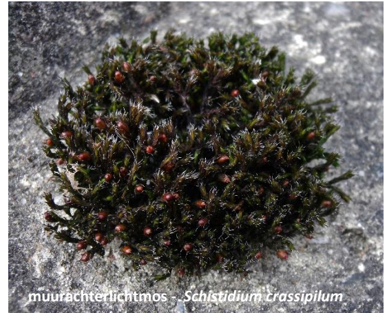
muurachterlichtmos - Schistidium crassipilum

In het struikgewas en op bomen langs het parkeerterrein vonden we zijdemos, helmroestmos, dwergwratjesmos en diverse haarmutsen, zoals gekroesde, gewone, grijze en broedhaarmuts. Verder een aantal plekken met fraai ontwikkeld vliermos en schijfjesmos.