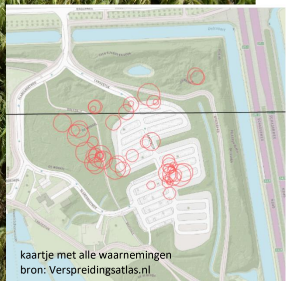
kaartje met alle waarnemingen