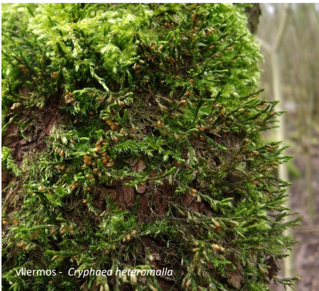
vliermos - Cryphaea heteromalla

Even verder deden we de vondst van de dag: blauw boomvorkje. Er zaten grote plakken op een boomstam. Blauw boomvorkje is nieuw voor het gebied. Nieuw voor de kilometerhokken die we bezochten waren verder rond en gerimpeld boogsterrenmos, broedkroesmos, bleek dikkopmos, klei-snavelmos en zelfs muisjesmos.