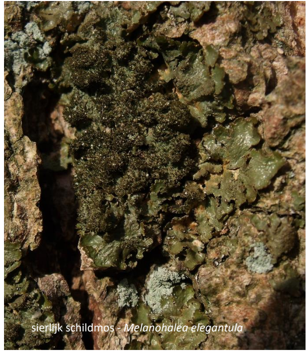
sierlijk schildmos - Melanohalea elegantula