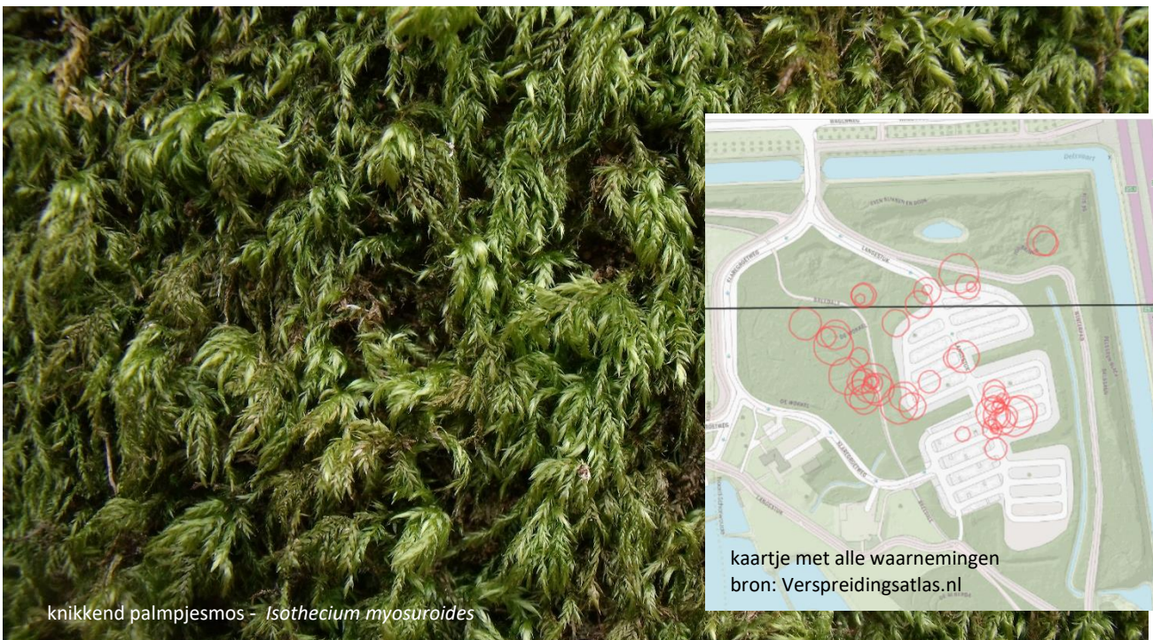
knikkend palmpjesmos - Isoetecium myosuroides

Naast interessante mossen deden we nog een leuke vondst. Op enkele plukjes gewone haarmuts vonden we het boommosschijfje, waarmee voor deze soort weer een nieuw uurhok is ontdekt!