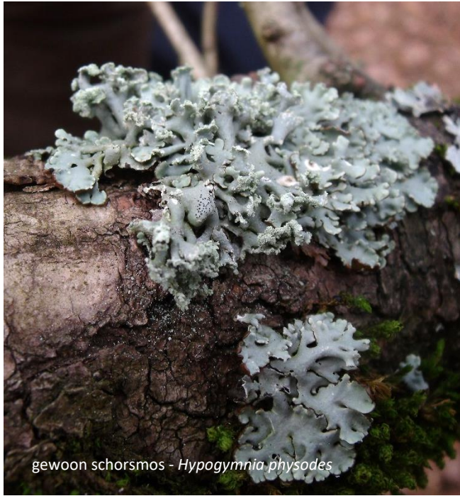
gewoon schorsmos - Hypogymnia physodes