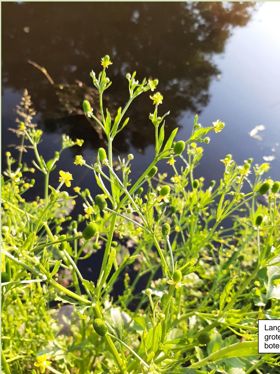
Langs de waterkant stonden fantastisch grote exemplaren van de blaartrekkende boterbloem in bloei.