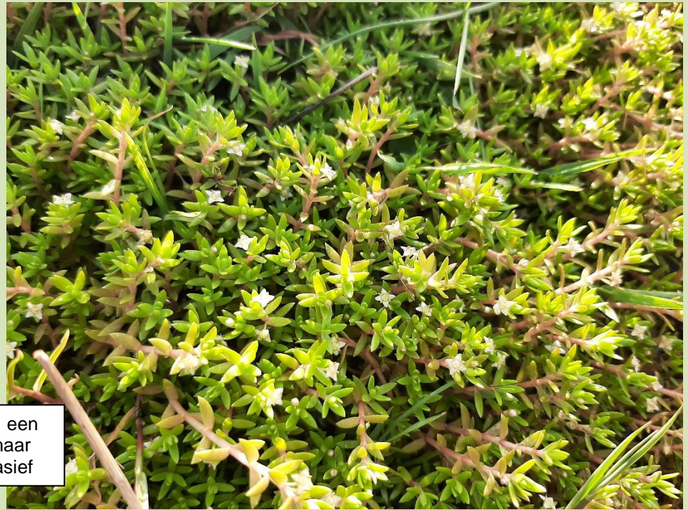
Watercrassula, een mooi plantje, maar helaas erg invasief