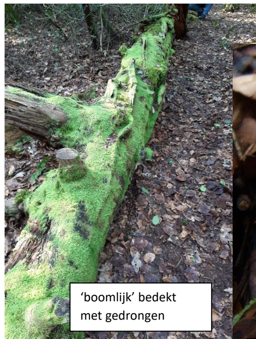
'boomlijk' bedekt met gedrongen