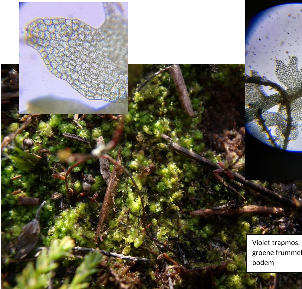
Violet trapmos. Op het eerste gezicht groene frummeltjes op een vochtige bodem