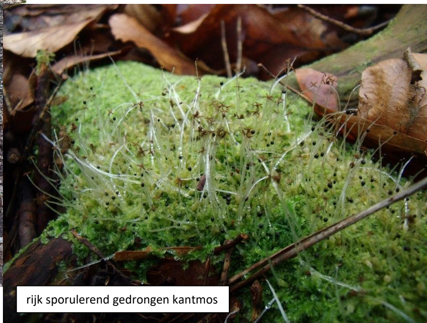
rijk sporulerend gedrongen kantmos