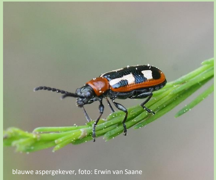
blauwe aspergekever