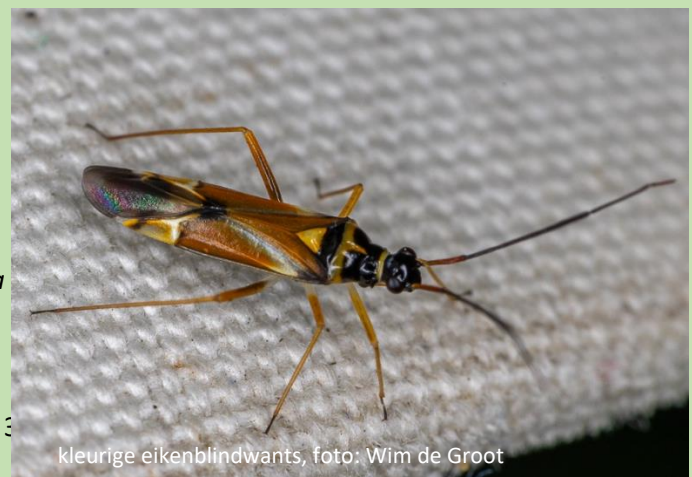
kleurige eikenblindwants