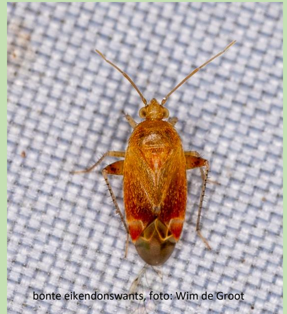
bonte eikendonswants

Tuinwolfspin - Pardosa amentata Tweekleurige bloemkever - Isomira murina Viervlek - Libellula quadrimaculata Vroege glazenmaker - Aeshna isoceles Vuurjuffer - Pyrrhosoma nymphula Vuurwants - Pyrrhocoris apterus Wolfspin (Pardosa) onbekend - Pardosa spec. Wolkever onbekend - Lagria spec. Zandschildwants - Sciocoris cursitans Zandschuinschild - Trapezonotus arenarius Zandviltvlieg - Acrosathe annulata Zesvlekkige groefbij - Lasioglossum sexnotatum Zesvleksmot - Chrysoesthia sexguttella Zevenstippelig lieveheersbeestje - Coccinella septempunctata Zilvermijnmot - Acrocercops brongniardella Zuringrandwants - Coreus marginatus Zuringvlieg - Pegomya solennis