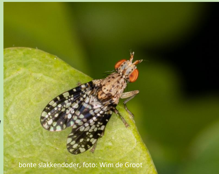
bonte slakkendoder