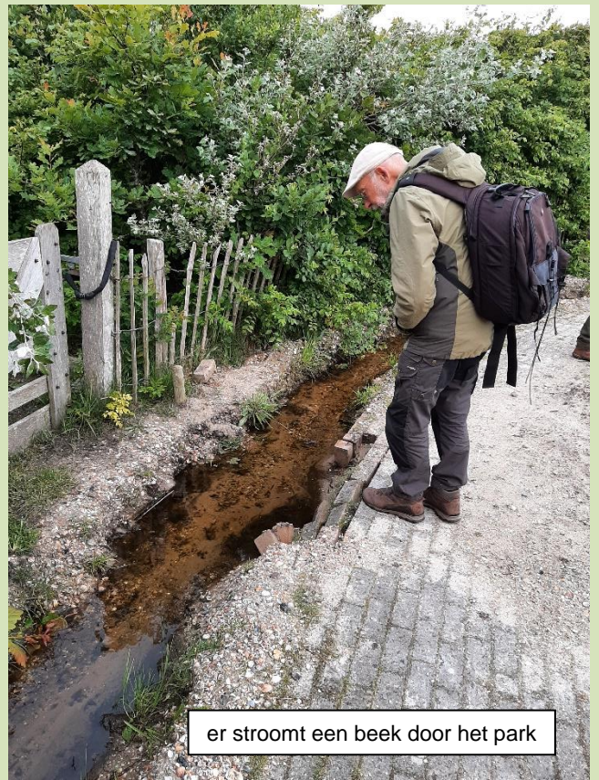
er stroomt een beek door het park